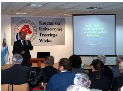
Inauguracja roku akademickiego KUTW.