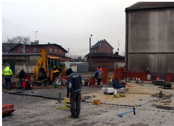
Prace na parkingu przy urzędzie.

Boisko wielofunkcyjne o nawierzchni poliuretanowej przy Szkole Podstawowej w Czempiniu. Koszt budowy tego boiska miał wynieść 330 tys. zł., a dofinansowanie z Ministerstwa Sportu i Rekreacji 162.000 zł. Jednakże z uwagi na duże - 10 miesięczne - opóźnienie zakończenia prac, firma wy-