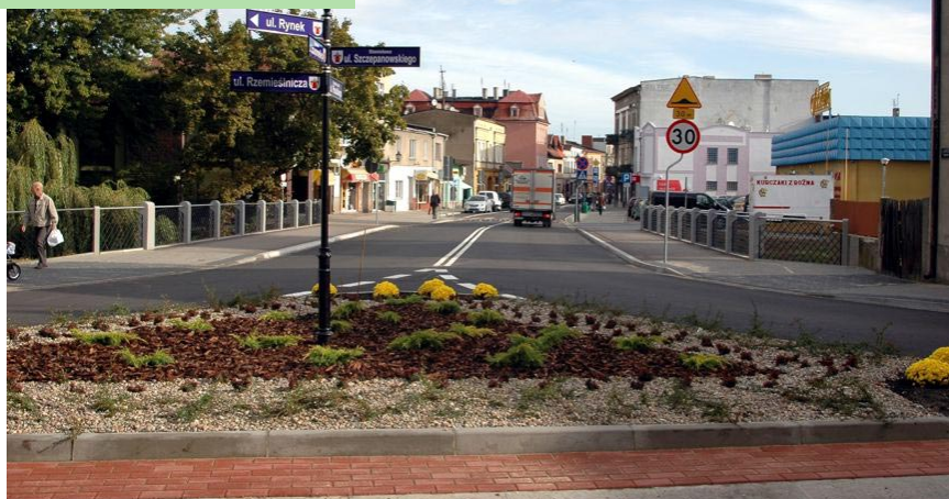
Największa inwestycja drogowa w Kościanie - przebudowa ul. Piłsudskiego.

W Lubiniu wyremontowano drogę obok cmentarza. Z kolei w Łuszkowie i Świńcu wyremontowano chodniki. W Świńcu remont ponad 800 metrowego odcinka chodnika kosztował ponad 112 tys. W Łuszkowie natomiast wyremontowano ponad 300 m chodnika. Gmina Krzywiń prace w tych czterech miejscowościach, wsparła kwotą 200 tys. złotych a pozostałe środki pochodziły z budżetu powiatu. Największa tegoroczna in-