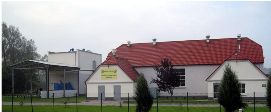
Oczyszczalnia Ścieków w Racocie.

1. Rozbudowa oczyszczalni w Racocie. Ogólny koszt inwestycji 4,5 mln zł. Na zadanie udzielono pożyczkę z WFO-ŚIGW w kwocie: 2,5 mln zł. Wykonawca: PPU PRO-MET z Koźmina Wielkopolskiego.