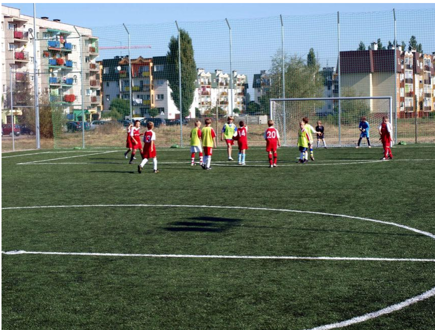
Kompleks boisk z programu Orlik 2012. Jedna z najdroższych inwestycji miejskich w 2009 r. współfinansowana jednak przez Ministerstwo Sportu i Urząd Marszałkowski.

a jednocześnie stworzyło dobre perspektywy na kolejny rok. Mimo konieczności spłaty 5 646 000 zł z tytułu zadłużenia w 2009 r., w mieście pojawiły się ważne inwestycje.