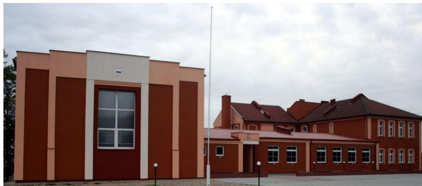
Szkoła Podstawowa w Kokorzynie.

3. Sala sportowa w Turwi. Wykonawcą była firma KONTRAKT ze Świąciechowy. Koszt tej inwestycji to 1.293.553,00 zł.