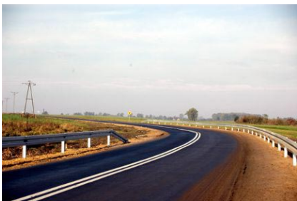
Fragment drogi Czarkowo - Grażyna.

Tegoroczne inwestycje, zrealizowane na łączną wartość 14 mln 800 tys. zł., zostały zdominowane przez remonty dróg, na które przeznaczono ponad 12 mln zł. Udało się wyremontować ulicę Poznańskie Przedmieście w Czempiniu, gdzie wykonano nową nawierzchnię, nowe chodniki i krawężniki po obu stronach ulicy, wyznaczono miejsca parkingowe i azyle dla pieszych. Przygotowano także duży parking przy cmentarzu. Remont ulicy i prawie 4 km drogi w stronę Iłowca to koszt ponad 1,5 mln. złotych. Część kosztów pochodziła z budżetu powiatu oraz gminy Czempień, resztę, ponad 752 tys. zł, pozyskano w ramach „Narodowego Programu Przebudowy Dróg Lokalnych 2008-2011”. Drugą, wyremontowaną z tego programu drogą, jest trasa z Czarkowa do Grażyny. Koszt całej inwestycji to